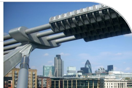
Londra, Nodo Millenium Bridge - Inarcassa 2016