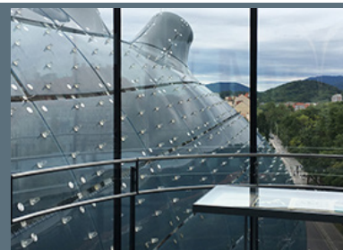
Kunsthause, Graz - Inarcassa, 2019