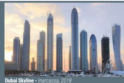
Dubai Skyline - Inarcassa, 2018