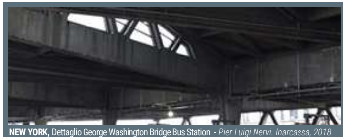
NEW YORK, Dettaglio George Washington Bridge Bus Station - Pier Luigi Nervi, Inarcassa, 2018