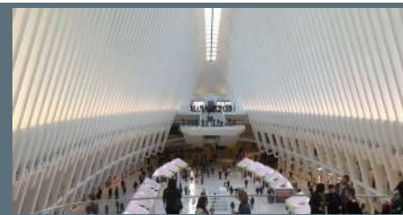
New York, The Oculus World Trade Center Transportation Hub at Ground Zero - Inarcassa, 2018