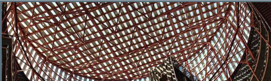
Chicago Dettaglio Thompson Center Inarcassa, 2013