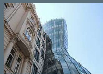
Praga, La Casa Danzante - Inarcassa, 2018