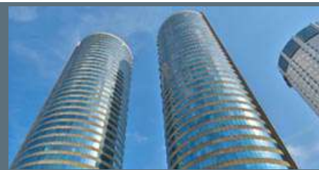
Colombo, World Trade Center - Inarcassa, 2018