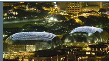
Singapore, Esplanade - Theatres on the Bay - Inarcassa, 2018