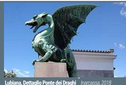
Lubiana, Dettaglio Ponte dei Draghi Inarcassa, 2018