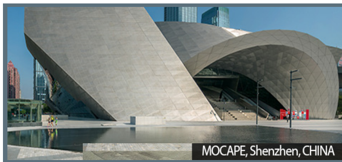
MOCAPE, Shenzhen, CHINA