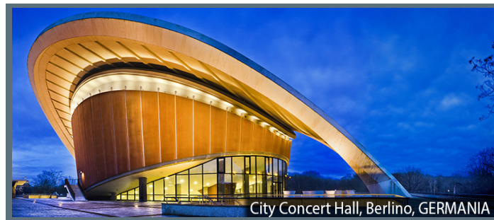
City Concert Hall, Berlino, GERMANIA